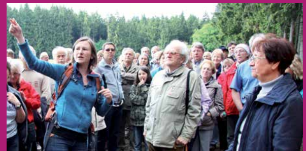
Wanderung zum Altheimer Erdwerk am 17. Mai 2012

Dauer: ca. 3 Stunden. Die Teilnahme ist kostenlos.